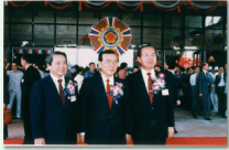
院慶會所暨典主主持開工典禮

醫院尚在計畫階段，就開始為了連外道路與高雄市政府以及交通部協商斡旋，決議在國道1號334+870處設置交流道；75年底開工動土後，高雄市政府專案小組適時配合辦理基地前大中路及榮總路等二側道路闢設，除進出工地更加便利外，工程得以全面展開不再受狹小道路的限制，後續更是帶動了整個高雄榮總地區的發展。