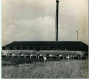
王新模窯業股份有限公司磚窯廠舊照

本院院區的土地，大部分是「王新模窯業股份有限公司」工廠用地，廠區現已不復見，院方卻留下了當年業主居住的房子－紅樓。這座兩層樓的磚房聳立在此已逾一甲子的時光，曾經是充滿家庭天倫之樂，因緣際會下，又見證了南部地區醫療大業，迄今仍擔負著社區復健中心的任務，持續為每一個有需要的人發光發熱。