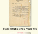
美軍顧問團建議成立榮民專屬醫院

為了加強南部地區榮民榮譽，以及地方民眾的醫療服務，促進南部醫學教學並帶動醫療水平，72年輔導會陳報了籌建臺北榮總高雄分院綱要計畫以及需求，經過層層審查核定，74年8月1日成立了臺北榮總高雄分院籌備處，並列為國家十四項重要建設之一。