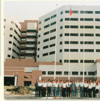
民國79年10月10日本院首次升旗典禮