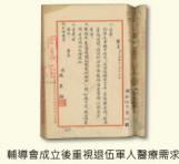
輔導會成立後重視退伍軍人醫療需求

輔導會成立之初，並無專屬醫療院所，僅就地借用接管軍方療養院設備，收容因戰、公傷無法繼續服役的退伍軍人；配合國家政策，榮民人數日漸增多且年齡逐年增長，醫療需求更與日俱增，民國44年1月成立醫療計畫實施委員會，45年成立醫務處（第六處），這是輔導會就醫體系之始。